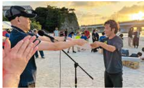
実行委員長から3位入賞の賞状を受け取る