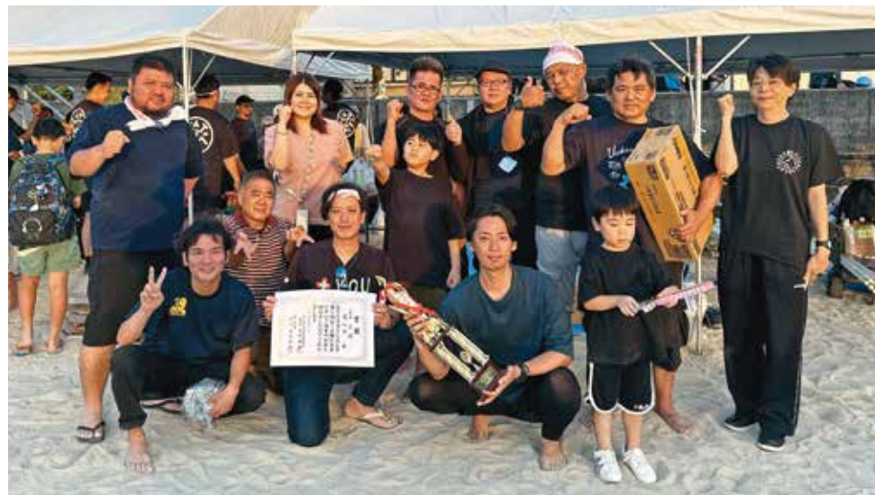
表彰式終了後の記念撮影