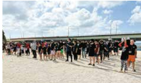
「第30回 ビーチ綱引大会」開会式