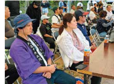
角力大会を見守る救護班