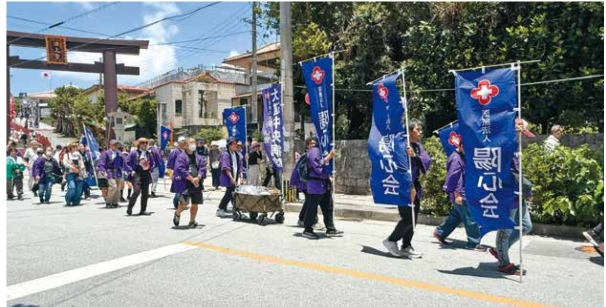
波上宮からパレットくもじ前広場まで練り歩く神幸祭