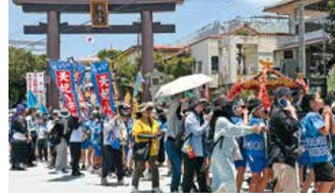
みこし行列。上から波上宮神輿保存会、若狭小学校、天妃小学校(2つの小学校のみこしは陽心会が寄贈)